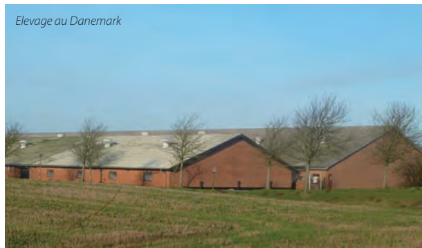
Elevage au Danemark