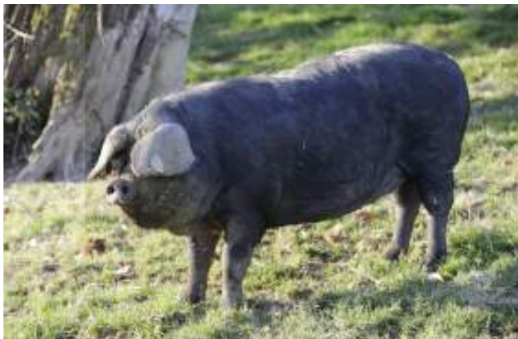
Porc Gascon (crédit photo Consortium Noir de Bigorre).

L'IFIP intervient dans la certification des reproducteurs en tant qu'agent identificateur. Pour ce faire, l'IFIP effectue des visites d'élevages majoritairement dans les races qui n'ont pas d'animateur. Les certifications sont réalisées par des commissions d'agrément élues en réunions de comités pilotes (éleveurs experts et