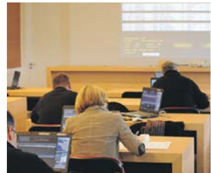
Le Marché du porc breton, association de mise en marché des porcs charcutiers et des cochons.

de l'épidémie de FPA. Immédiatement, les marchés chinois, japonais et sud-coréens se sont refermés. L'année 2020 se clôture également avec la conclusion d'un accord entre le Royaume-Uni et l'UE à propos du Brexit.