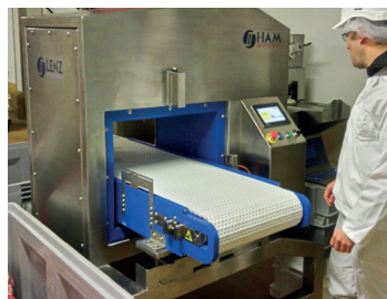
Fig.1 : Scanner à induction magnétique