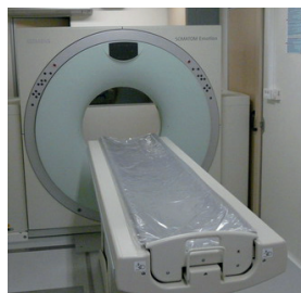
Fig. 2 : Scanner à rayons X