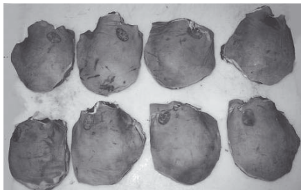
Figure 2 - Différences de découpe de l'épaule selon la méthode européenne pour la dissection par huit bouchers sur quatre carcasses (en vertical, les deux demi de la même carcasse)