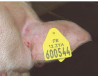
Boucle portant un n° individuel (reproducteur importé).