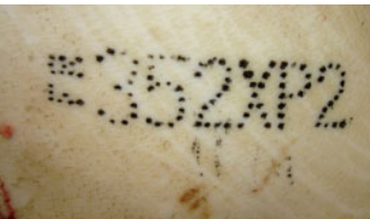
Tatouage d'un indicatif de marquage complété par un n° de lot.

Le code ISO de la France, obligatoirement en première position, peut être apposé, selon les matériels, de la manière suivante :