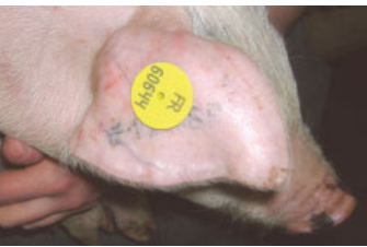
Boucle portant un indicatif de marquage.