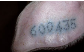
Tatouage du n° ordre d'un n° individuel de reproducteur.