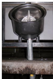
abreuvoir LA BUVETTE