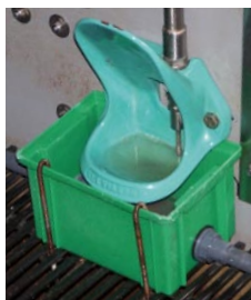
abreuvoir RICO SUEVIA

tement). Un abreuvoir (LA BUVETTE B15 S) par case est associé à un système de récupération. L'eau collectée, pour 4 loges d'une même rangée, est dirigée vers un bac placé à l'extérieur de la salle. L'eau consommée globalement pour ces quatre cases est totalisée par un compteur. Le débit témoin est de 1 l/min, et le réglage est de 2 l/min pour l'autre traitement.